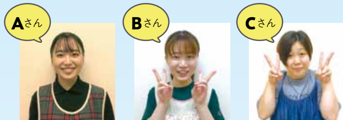
Aさん 1年目の保育士。 おしゃれ大好き!