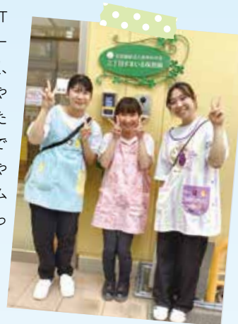
※エプロンの指定はありません。

保育中の服装はTシャツやトレーナー等フードのない服、スキニーパンツやチノパンといった動きやすい服装です。スウェットやジャージ、デニムパンツはNGとなっています。